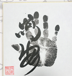
●力士直筆サイン例

お楽しみコーナー&抽選会も実施 開場直後からの力士四名による握手会のあと、力士に直接質問して大相撲の知識を深めていただける質問コーナーや、ご来場の皆様から抽選で20名様に、力士直筆サインや相撲土産が当たる、お楽しみ抽選会も行います。巡業ならではの楽しい企画が盛りだくさんです。